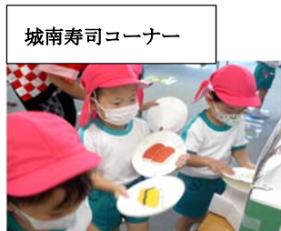
城南寿司コーナー