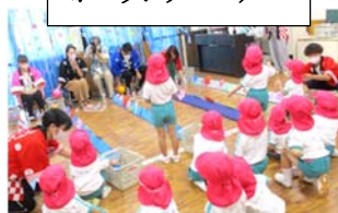
ボーリングコーナー