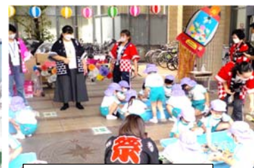
ボールすくいコーナー